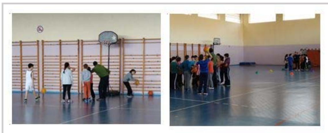
Figura 2. Monitores dando feedback durante el estudio piloto.

En cuanto al uso de la ficha, ésta fue utilizada y rellenada al final, ya que resultaba difícil rellenarla en plena sesión. Por otra parte, todos los monitores y monitoras realizaron feedback continuo en forma de pregunta para ayudar a los niños a reflexionar sobre lo que hacían, tratando en todo momento que este fuera positivo y formativo. Éste fue dado de forma individual y grupal, con el fin de que los infantes fuesen conscientes de cómo mejorar en la práctica deportiva, como se muestra en la figura 2.